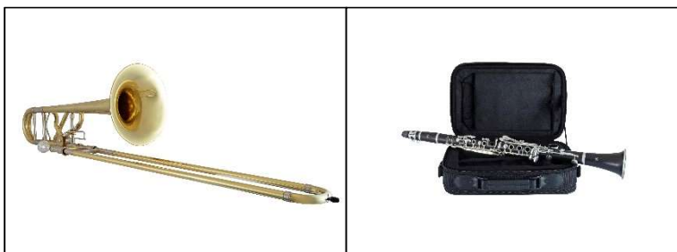
康塞爾默旗下的 Bach 手工製造專業級中音長號和 Leblanc “Serenade II” 單簧管

康塞爾默樂器（ Conn-Selmer ）將在 Music China 現場展示 Bach Stadivarius 手工製造長號系列的全新擴展組件，以及適合學生和中級演奏者的全新薩克斯、小號、長號、單簧管。此外，康塞爾默旗下的 Ludwig 品牌也將帶來前所未見的新產品，讓粉絲大飽眼福。